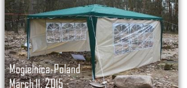
לרגל ההילולא קדישא של רבינו הק' רבי ר' אלימלך מ'ליזענסק זי"ע

* ויצנך חמס משה. אמר להם יהי רצון שמהרה שכינה נצמעה ידכס. והיה נועם ד' אלקינו עלינו וגו'. (רש"י סס)